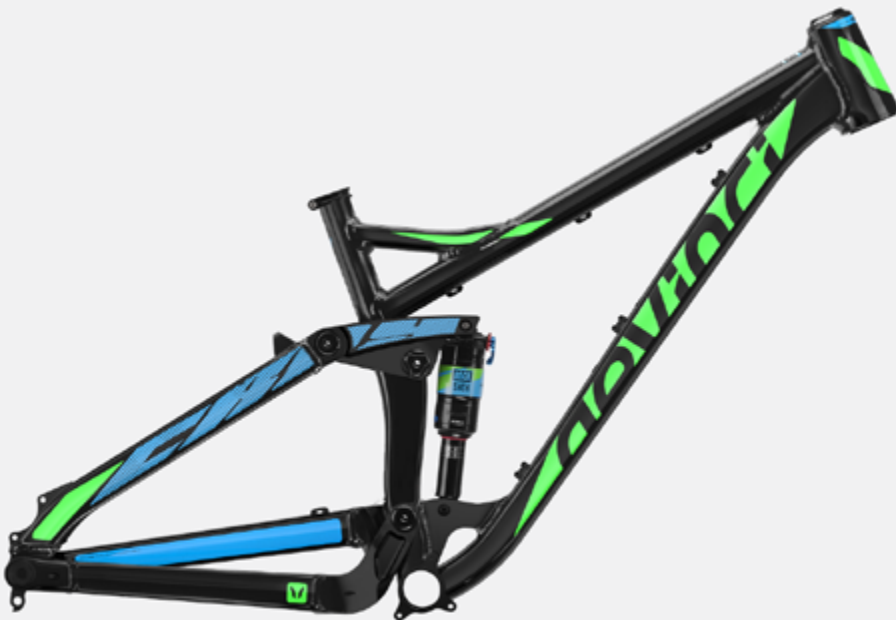
LUSTRÉ | NOIR, BLEU, VERT