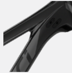
LUSTRE | CARBON, CHARCOAL